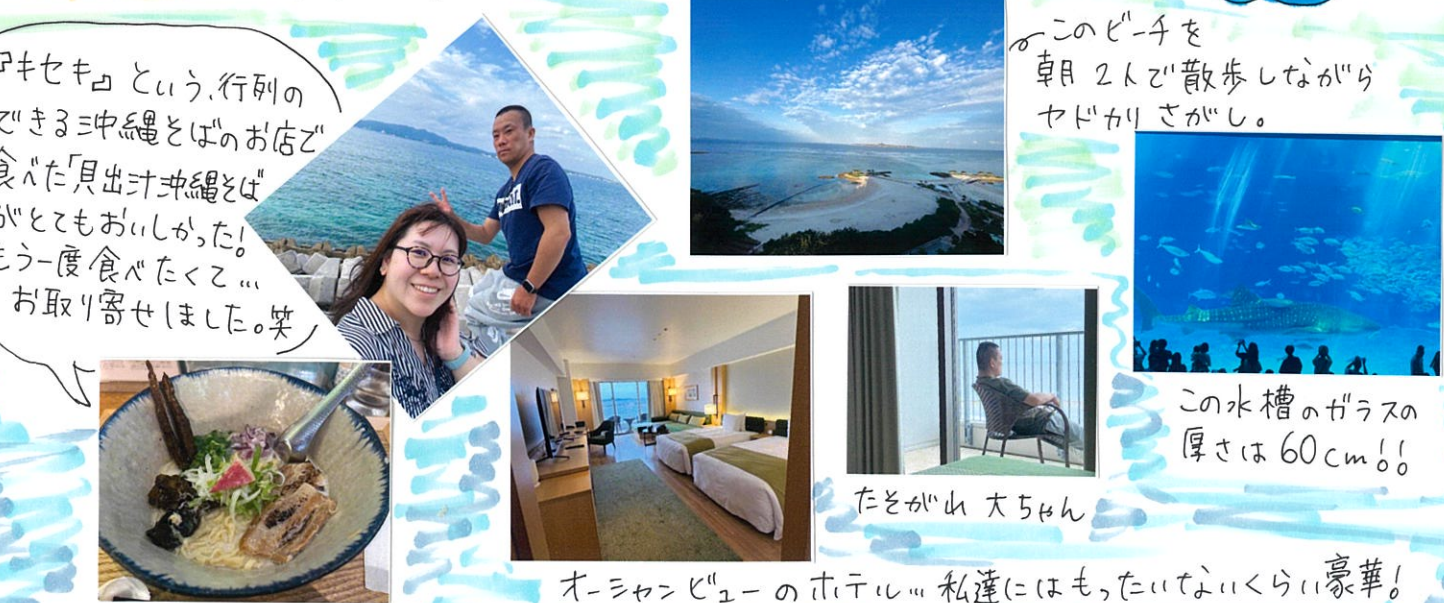
🍷キセキ という行列の できる沖縄そばのお店で 食べた「貝出汁沖縄そば」 がとてもおいしかった! もう一度食べたくて... お取り寄せしました。笑

いる、お2人のステキな姿にこちらまで幸せな気持ちに😊 おいしいお料理と楽しい時間、心もお腹もいっぱい な1日でした🎵