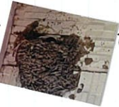
今年の5羽兄弟 今年のひとり子

この写真を撮った翌日 27日朝には もう巣立っており、巣は空 っぽでした。 巣立った後もしばらくは近くにいます様で、夕方に なると周囲をたくさんのツバメがウロチョロしています☆