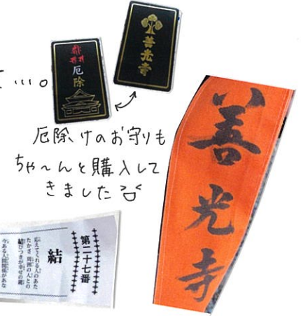
厄除けのお守りも ちゅんと購入して きました👉