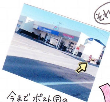
今までポスト①の あった所に 新しい看板が 立ってますヨ〜