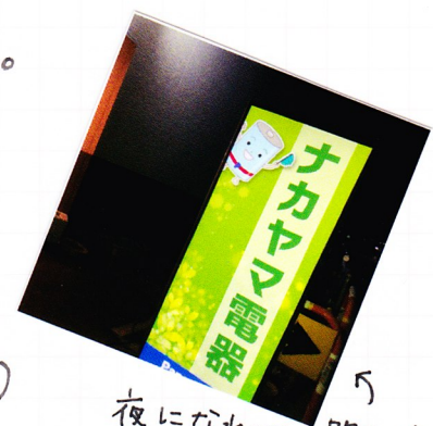
夜になれば“明るく光って 店の場所をお教えします”