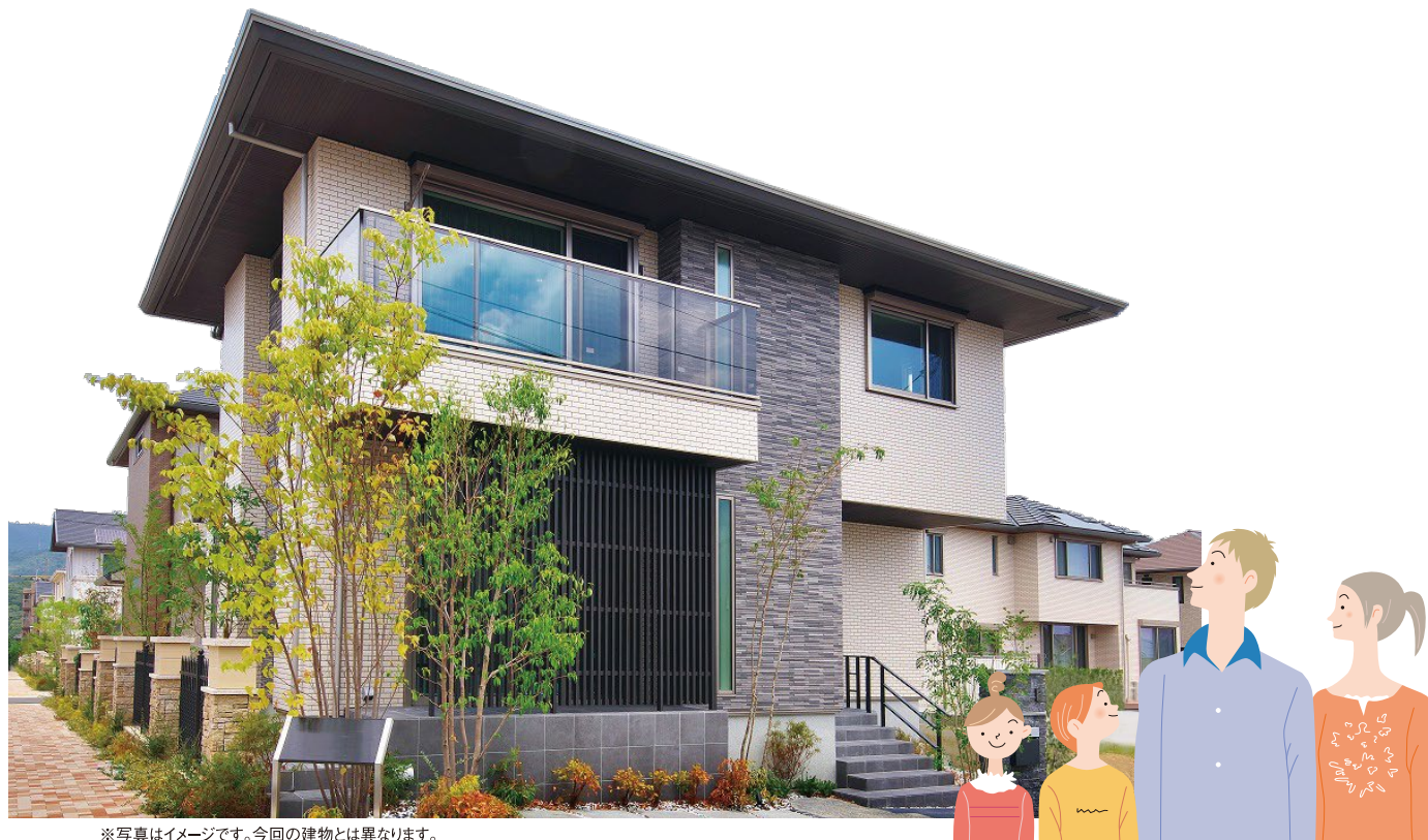
※写真はイメージです。今回の建物とは異なります。