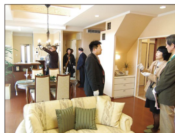
※写真はすべてイメージです。詳しい内容に関しましては裏面をご覧ください。